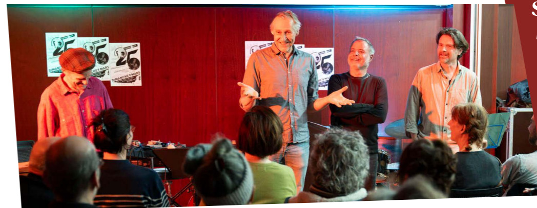
La fine équipe...

SÉLECTION DE TÉMOIGNAGES, ENVOYÉS PAR MÉLS OU ÉCRITS DANS LE LIVRE D'OR