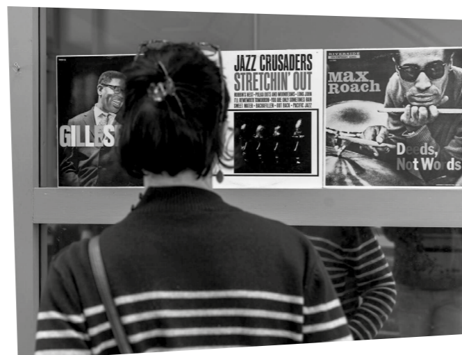
Replonger dans l'histoire...