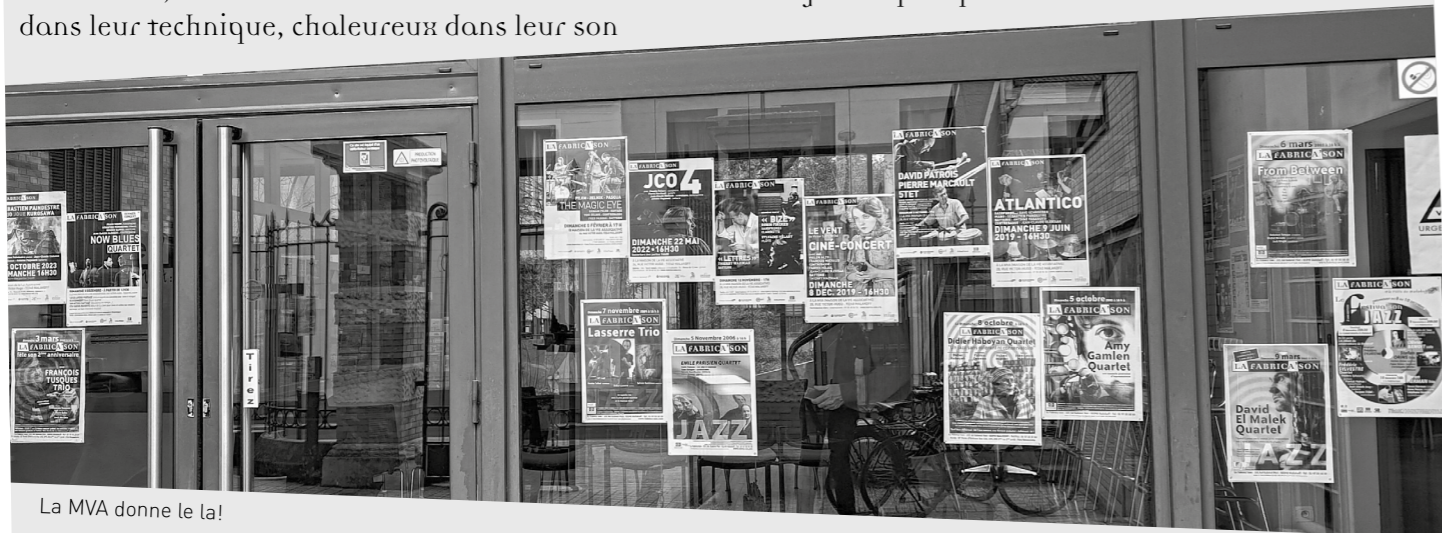
La MVA donne le la!

tout a commencé en fin de matinée avec des aiguilles en acier, de la gomme-laque, une manivelle et une valise... oui, je parle bien de musique puisque ce sont des éléments de mon gramophone de 1928 et des vieux disques 78 tours que j'ai eu le plaisir de faire tourner et de commenter, véritables mémoires ambulantes du blues et du jazz depuis plus d'un siècle. sobres dans leur technique, chaleureux dans leur son