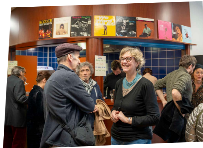
Le bar est tout vert!